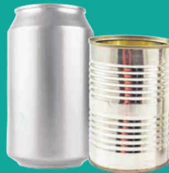
Latas de metal vacías (sin tapas)