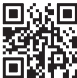
Sitios de recolección de mantillo

En el condado Pinellas se trituran los desechos del jardín y se convierten en mantillo para que los residentes los reutilicen. El condado Pinellas ofrece mantillo gratis en lugares convenientes, solo traiga una pala y un contenedor de transporte y tome todo lo que necesite. ¡Su jardín se lo agradecerá! Para obtener más información, visite Pinellas.gov/mulch o escanee este código QR para obtener un mapa en línea de los sitios de recolección de mantillo.