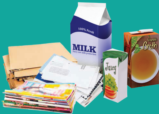
Cartón aplanado, papel limpio, correo desechable, cartón

Coloque solamente estos artículos en el contenedor de reciclaje. Todo limpio y seco. No se permiten bolsas de plástico. No se permite reciclar en bolsas.