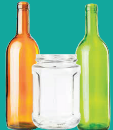
Botellas de vidrio vacías, frascos (sin tapas)