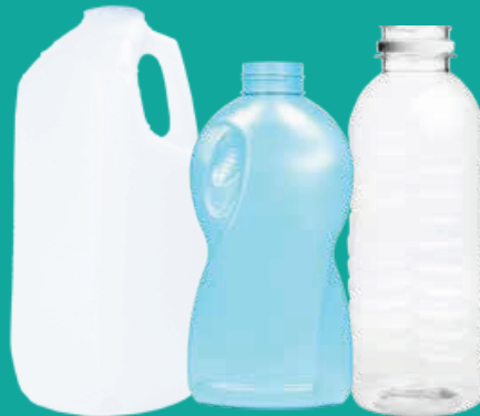
Botellas de plástico vacías, jarras (sin tapas)