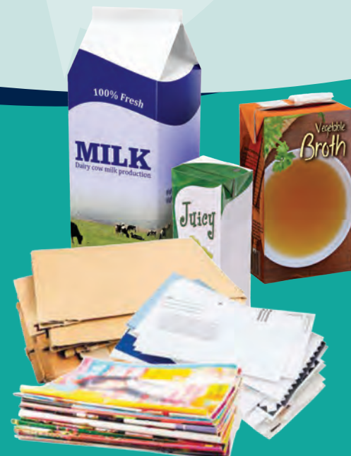
Cartón aplanado, papel, correo desechable, periódicos, cartulina, cajas de cartón

¡Lea esta información para saber qué se puede y qué no se puede reciclar en el condado Pinellas; dónde se encuentra el centro de reciclaje más cercano; dónde puede llevar los residuos domésticos peligrosos y mucho más!