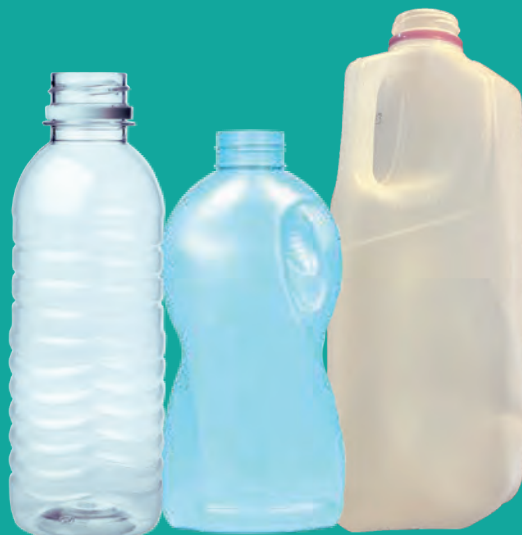
Botellas de plástico vacías, jarras (sin tapas)