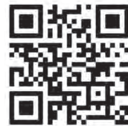
Mapa de arrecifes artificiales

El condado Pinellas reutiliza materiales ecológicos, como hormigón, tuberías y vigas de acero, para construir arrecifes artificiales. Estos arrecifes proporcionan un hábitat valioso para la vida marina y crean atractivos lugares para que los buceadores exploren. Puede encontrar la ubicación de los arrecifes en nuestro mapa en línea visitando Pinellas.gov/reef o escaneando este código QR.