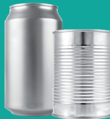
Latas de metal vacías (sin tapas)