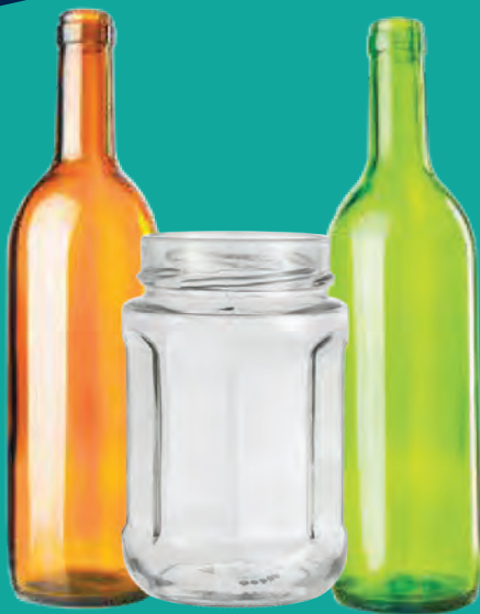
Botellas de vidrio vacías, frascos (sin tapas)

Todos los artículos deben estar limpios y secos.